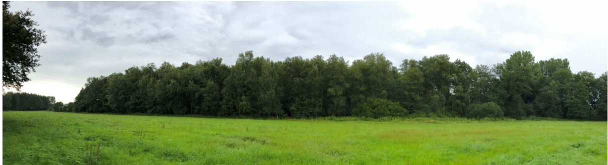
1,5 ha -- 1,5 Std nördlich von Eimsbüttel -- 15 t CO 2 Bindung / Jahr.

Für den Kauf dieses unseres ersten Waldes benötigen wir noch weitere ca. 14.000 EUR.